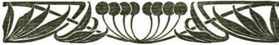
TABLE DES MATIÈRES