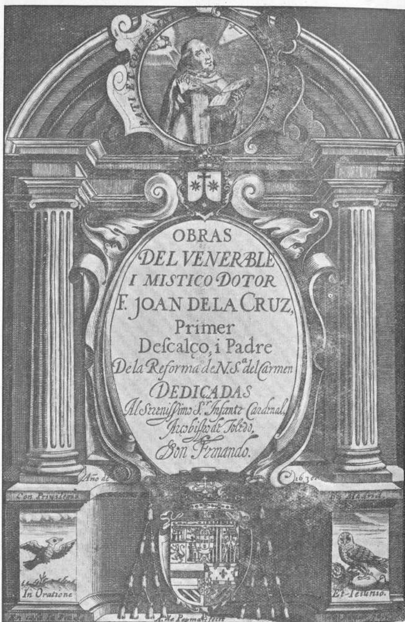
Portada de la edición de 1630